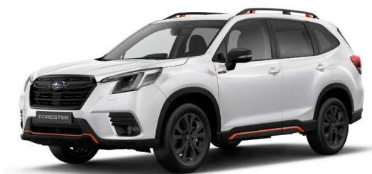
Crystal White Pearl