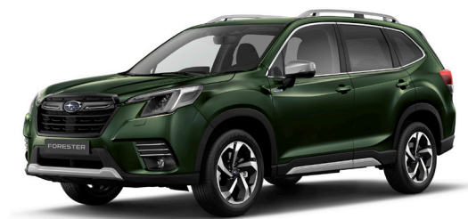
Cascade Green Silica